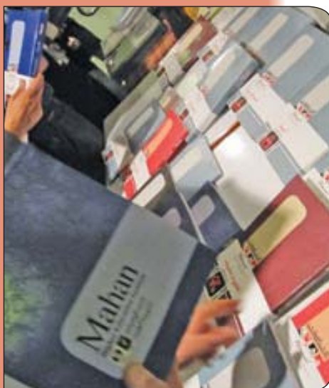
مهر سبجان به عنوان ناشر اختصاصی کتاب‌های ماهاان فعالیت می‌کند.